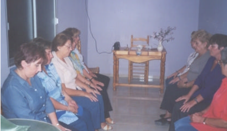
Members of Samadhi Branch in Alicante, Spain meditating for peace

mucho amor. En la ciudad de Oruro, un miembro se ocupa casi exclusivamente de los animales.