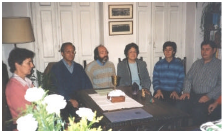
Members of Alicante Branch in Madrid, Spain performing the TOS healing ritual.