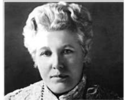
La Dra. Annie Besant, fundadora de la Orden Teosófica de Servicio